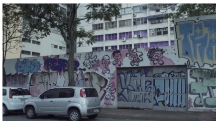
Still del documental Riscadas. Vitória – ES, 2018